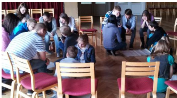
Neformālās izglītības nodarbība Jelgavā

Nereti skolotāji nejūtas pārliecināti, lai ar skolēniem runātu par seksuālās un reproduktīvās veselības tēmām. Tādēļ „Papardes zieds” brīvprātīgie vai speciālisti tiek aicināti uz skolām vadīt nodarbības par veselības jautājumiem. Nodarbības paredzētas 7. -12. klašu jauniešiem un tās noris, izmantojot grupu darbu, individuālo darbu, lomu spēles un diskusijas neformāla gaisotnē.