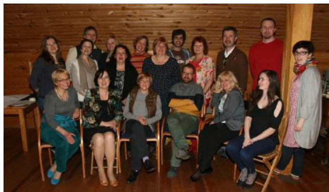
Komandas stiprināšanas pasākuma dalībnieki, „Mauriņos”, 12.05.2014.

Pasākumā, kas notika Allažu pagasta „Mauriņos” piedalījās 7 jauniešiem izvēlēti Padomes locekļi, 11 darbinieki – gan pilna, gan nepilna laika, 12 biedri. Dalībnieku vidū bija 2 jauniešu pārstāvji.