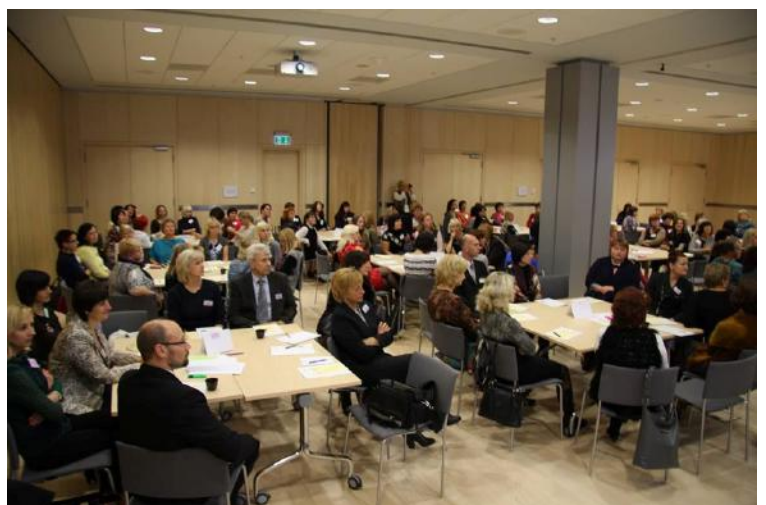
Skolotāju konference LNB, Rīgā, 15.10.2014.

2014. gada 15 oktobrī notika projekta „Es augu vesels” dalībnieku tikšanās konference Latvijas Nacionālajā bibliotēkā. Tā bija iespēja ielūkoties projekta mirkļos, iepazīties ar skolotājiem no visas Latvijas, tikties ar veselības jomas ekspertiem, piedalīties aktivitātēs, iepazīties ar bibliotēku. Konferencē piedalījās gandrīz 200 dalībnieku.