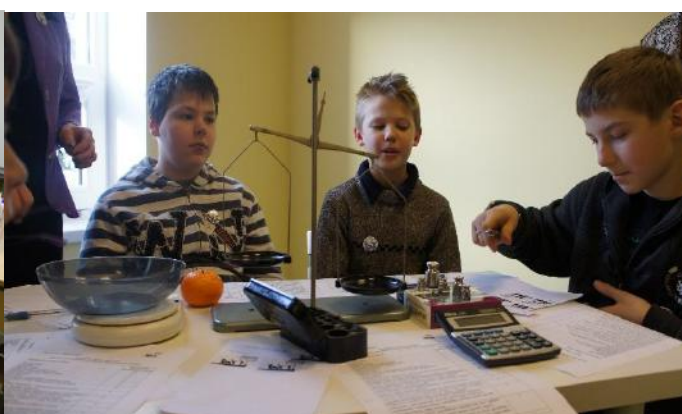
Nodarbība Džūkstes pamatskolā