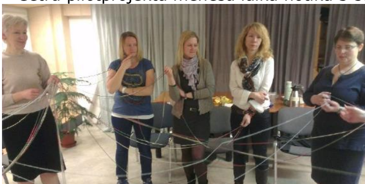
Pirmā speciālistu supervīzija, Rīgā, 11.04.2014.