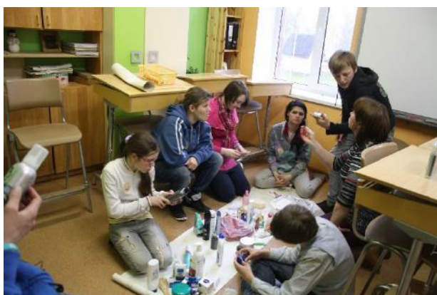
Nodarbība Zālītes speciālajā internātpamatskolā

2014. gadā, īstenojot projektu, 44 skolu 249 pedagogi ir apguvuši ar LR IZM saskaņotu pedagogu profesionālās kvalifikācijas pilnveides programmu (A, 12 h). Turklāt, apmēram 2000 skolēni mērķtiecīgi, interaktīvā veidā uzzinājuši, diskutējuši, eksperimentējuši, domājuši, zīmējuši un citādi radoši darbojušies vienā kopīgā tēmā – VESELĪBA.