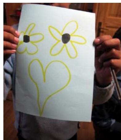
Romu jauniešu apmācība, Sabilē, 31.03.2014.