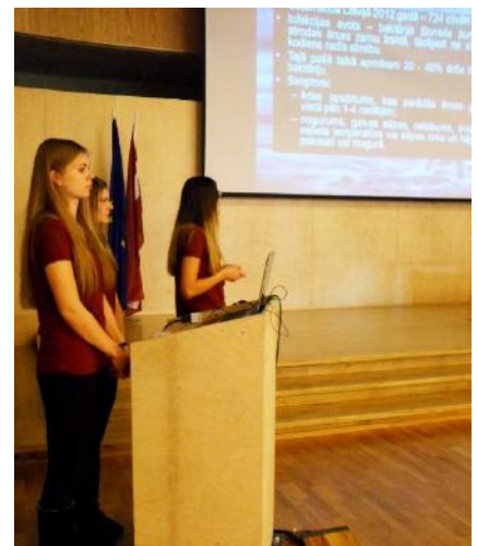
RSU studentu nodarbība Rēzeknē, 24.01.2014., klubā “Zeimuļs”