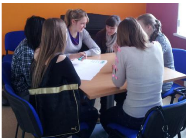
Neformālās izglītības nodarbība Jelgavā

2014. gadā novadītas 108 nodarbības, kurās piedalījies 1801 jauniešis.