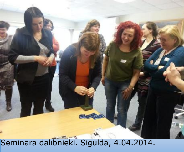
Semināra dalībnieki. Siguldā, 4.04.2014.