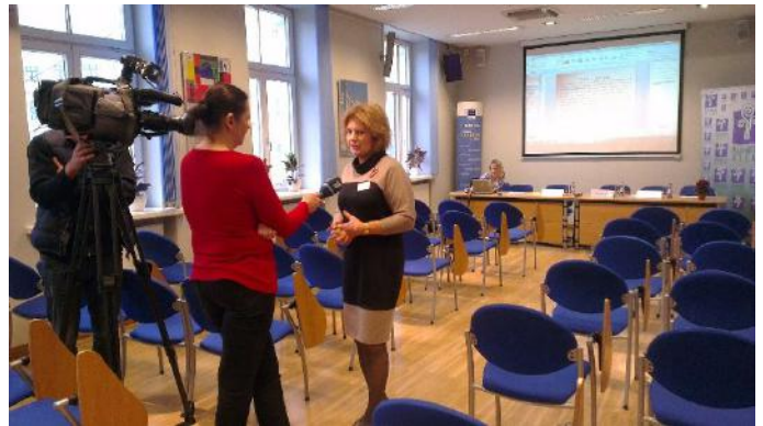
Preses konference par projekta norisi un ziņojumu prezentācija. Rīgā, 12.11.2014.

2015. gadā tiek gaidīts Eiropas Komisijas apstiprinājums projekta turpinājumam.