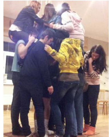
Vienaudžu izglītotāju apmācība

Gada sākumā no 10. – 12. janvārim un no 17. - 19. janvārim notika vienaudžu izglītotāju apmācība viesu namā „Ide”, kurā piedalījās 12 jaunieši no latviešu un krievu plūsmas skolām. Jauniešu apmācību vadīja „Papardes zieds” jauniešu speciālisti, kā arī piedalījās organizācijas brīvprātīgie. Sešās dienās jaunieši padziļināti apguva tādas tēmas kā pubertāte, attiecības, seksualitāte, lēmuma pieņemšana, kontracepcija, seksuāli transmisīvās infekcijas un neformālās izglītības metodes. Pēc apmācībām jauniešu zināšanas tika pārbaudītas, liekot viņiem sagatavot neformālās izglītības nodarbību un izpildīt testu ar 80 jautājumiem par iepriekš minētajām tēmām. Apmācībā piedalījās un sertifikātus ieguva 12 jaunieši.